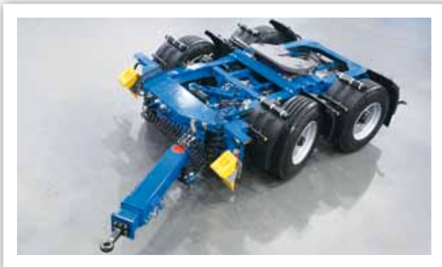
Dolly gelenkt, mit 1.150 mm Aufsattelhöhe

Lang-LKW mit lenkbarem Dolly – der Auflieger läuft innerhalb der 7,20 m breiten Kreisringfläche.