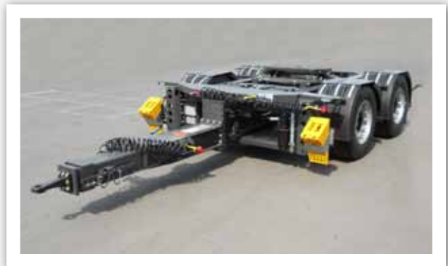
Dolly gelenkt, mit 980 mm Aufsattelhöhe

Das Zugrohr ist in zwei Basislängen für unterschiedliche Kuppellängen lieferbar. Das Maß von Mitte Zugauge bis Mitte Sattelkupplung beträgt dabei entweder 3.500 mm + 3x